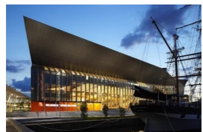
メルボルン国際会議場

先日、ヒューストンで開催された国際大会は、直接対面式での交流に勝ったものはないことを証明するものでした。新型コロナウイルスの影響で旅行が困難となっているアジア太平洋地域のロータリー会員の今のところ、着陸での国際大会は4年ぶりに直接顔を合わせることができる大会となります。演出してくれるでしょう。