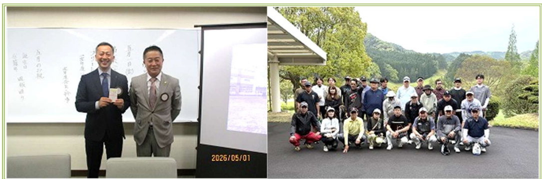
★ 網本会員に在籍祝